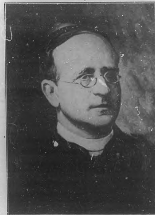
S. S. PIO XI El Papa de la "Fé intrépida". (Oleo de Valderrama.)

Hasta aquí la descripción que de tan importante acto nos hiciera hace unos momentos nuestro amigo. Como decíamos más arriba, ante ese Pontífice de la fé intrépida se abren, pues, lejanos horizontes que cabe esperar mucho de un hombre que durante los últimos años ha dado repetidas veces muestras evidentes de lo grande que es su corazón. Y para demostrar lo que decimos,