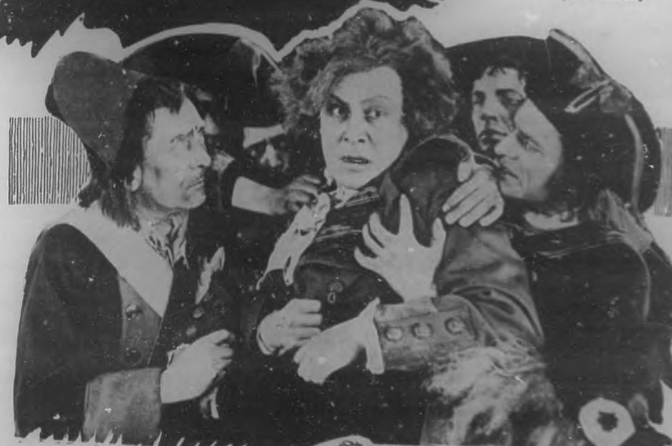
La aprehension de Danton

Los profundos conocimientos de Historia que posee el Director del "Heraldo de Cuba", prestan a su criterio sobre los hombres y las cosas de la Convención la más gran de autoridad; y las palabras del insigne catedrático, correspondiendo exactamente a la visión que de la Revolución Francesa y de los últimos días de Danton da la película de