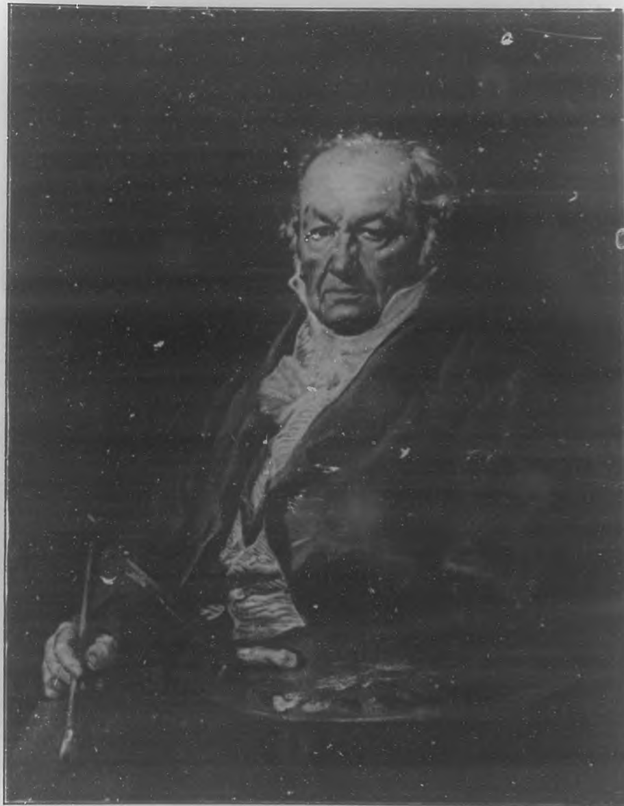
DON FRANCISCO GOYA Oleo de Vicente López.

(Para el libro próximo a publicarse "Como me lo contaron...")