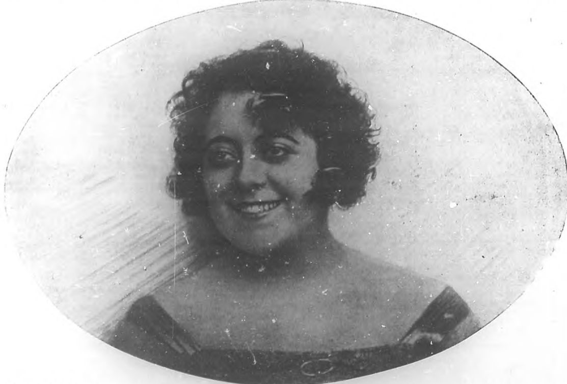
ANGELES OTEIN.—Eminente soprano ligera que está obteniendo ruidosos éxitos en el "Metropolitan" de New York, y ocupa el puesto que a principios de temporada ocupara la Galli-Curci.

Recientemente se ha dado a la proyección una grandiosa película cuyo asunto gira alrededor de Danton. Pero estudiándolo en su carácter íntimo, como hombre pasional y tierno, capaz de los más dulces amores. La citada película se denomina "Danton o todo por una mujer"; y, abarca las últimas aventuras amorosas del gran tribuno, aventuras que le trajeron la animosidad de Robespierre y culminaron en el cercenamiento de la cabeza del tribuno por la guillotina levantada en la explanada de las Tullerías.