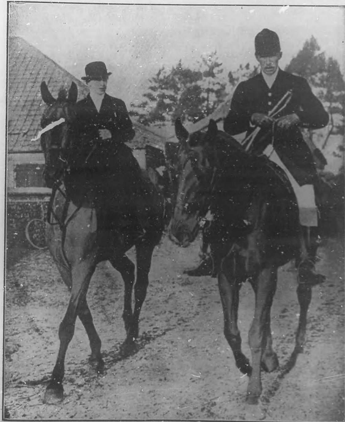
La princesa María de Inglaterra y Lord Lascelles, que recientemente contrajeron matrimonio, paseando a caballo por las cercanías de Londres, días antes de sus bodas.

Teléfono: Dirección: 1-1222; Administración, A-5665; Redacción, M-1368.