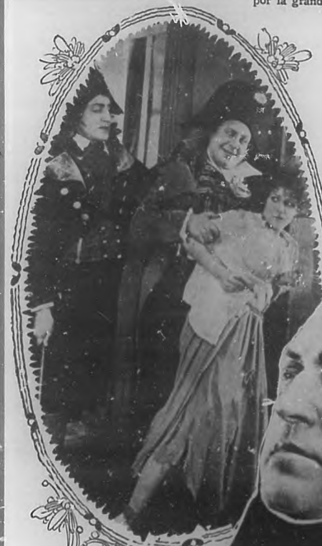
Escena del amor de Danton hacia Babette