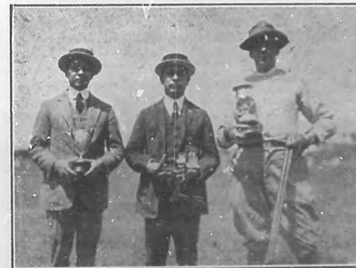
Los tres tiradores que obtuvieron los primeros premios en los matchs efectuados el domingo último en el "Club de Cazadores."

¡Cuánta esperanza perdida! ¡Cuán amargo deshonor!