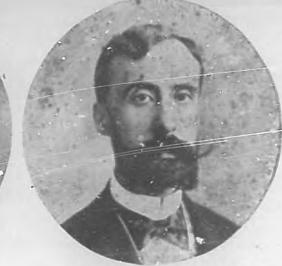
NARCISO ONETTI Y ZIÑIGO

El notable y popular actor que con tanto éxito actúa en "Payret".